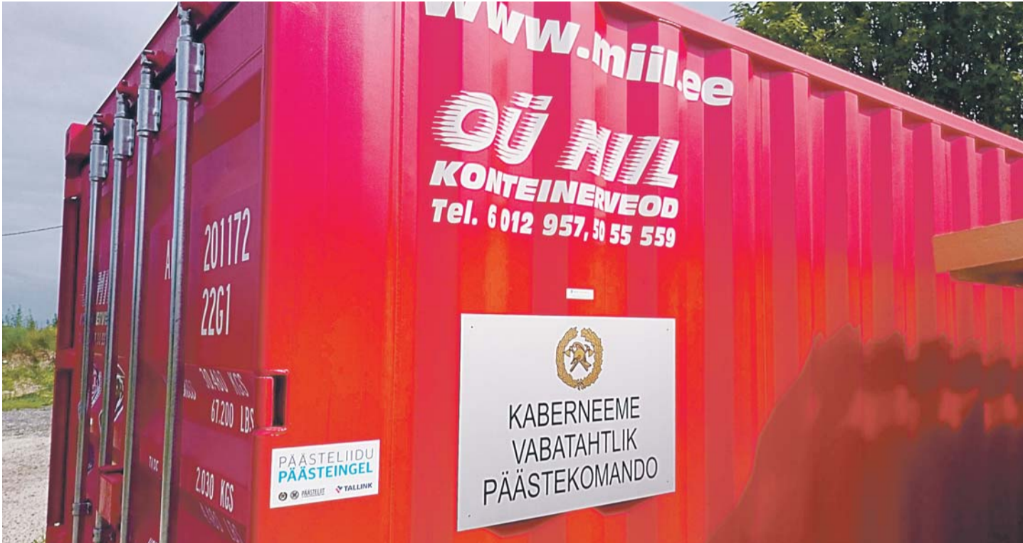
OÜ Miili meeste poolt Rootsist leitud ja kohaletoimetatud konteineris hoitakse varustust ning pärast depoohoone valmimist hakkab seal olema kogukonnale avatud töökoda või laoruum.

Samuti muutus lihtsamaks kiirabi ja tuletõrjajate abistamine – oleme võimelised neid vajadusel meie väikesaartele transportima vähema ajakulu ning märksa väiksemate riskidega. Tänu uuele radarile saa-