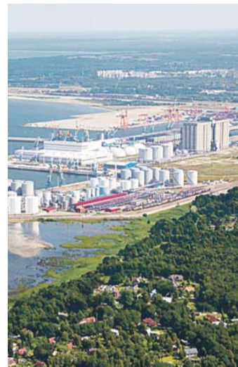
Fotol Muuga sadam.

Esimeses etapis on Muuga sadama idaosasse kavas rajada LNG vastuvõtu- ja jaotusterminal kuni 4000-kuupmeetris mahutipargiga. Kogu territooriumi pindala on ligikaudu 8500 ruutmeetrit. Terminal on esmajoones mõeldud laevade punkerdamiseks ja laevade tankimiseks. Järgmistes etappides