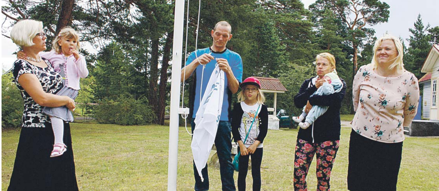
Külapäeva avatseremooniaks toovad noored Eesti lipu välja.